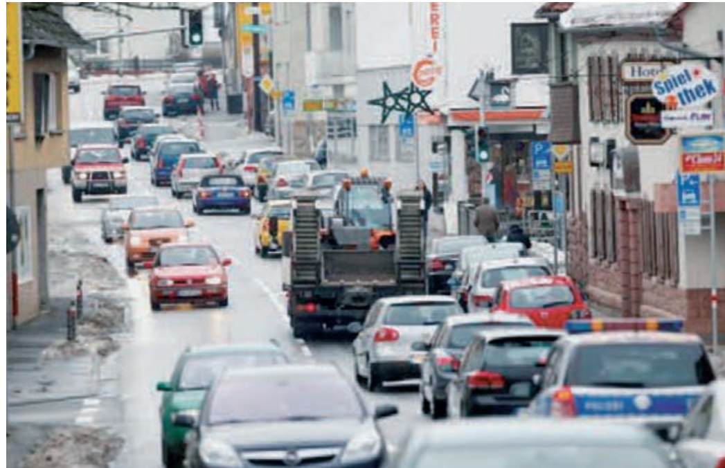
Der starke Durchgangsverkehr in Weilbach ist kaum noch zu ertragen

Raunheimer Straße in Richtung Eddersheim am Ortsausgang – Verengung der Straße auf eine Fahrspur –