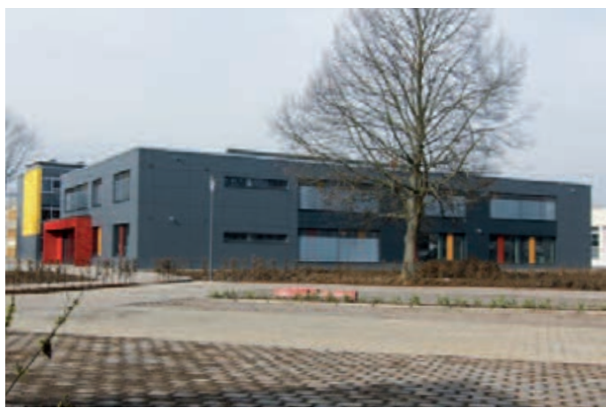
38 Millionen steckte der Main-Taunus-Kreis in die Erweiterung bzw. den Neubau der Gebäude des Graf-Stauffenberg-Gymnasiums und der Sophie-Scholl-Schule, 57 Mio. wurden insgesamt in die Schulen Flörsheim investiert.