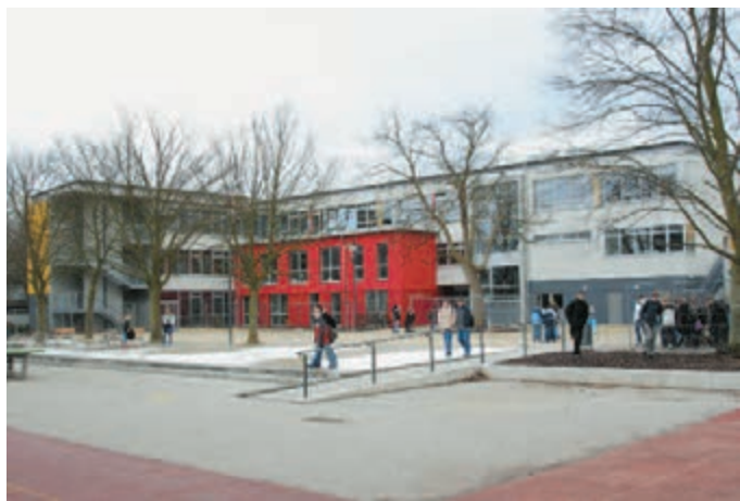
Bestmögliche Lern- und Arbeitsbedingungen für die Schülerinnen und Schüler sind in der neuen Sophie-Scholl-Schule entstanden.