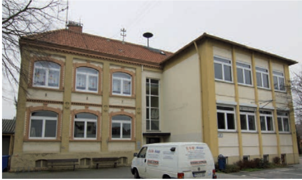
Es war ein langer, harter Kampf, bis wir die Schließung der bürgernahen Verwaltungsstellen in Weilbach und Wicker verhindert hatten. Unser Foto zeigt, die alte Schule in Wicker, wo die Verwaltungsstelle untergebracht ist.

Der Durchfahrtsverkehr ist in Wicker eines der größten Probleme. Nach der erneuten Ablehnung der B 519 (neu) im Bürgerentscheid dürfen die unmittelbar Betroffenen nicht im Stich gelassen werden. „Die CDU Wicker ist für alle Lösungen offen, die dazu beitragen, die Verkehrsbelastung des Stadtteils zu senken“, erklären Christopher Willmy und Nastasja Hartmann, die beiden Spitzenkandidaten für den Ortsbeirat.