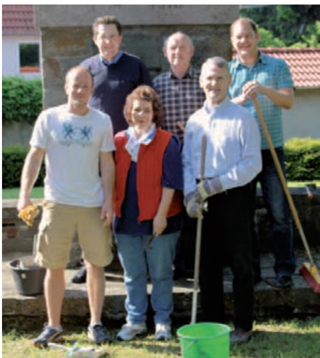
In regelmäßigen Abständen pflegt die CDU Weilbach das Ebrenmal