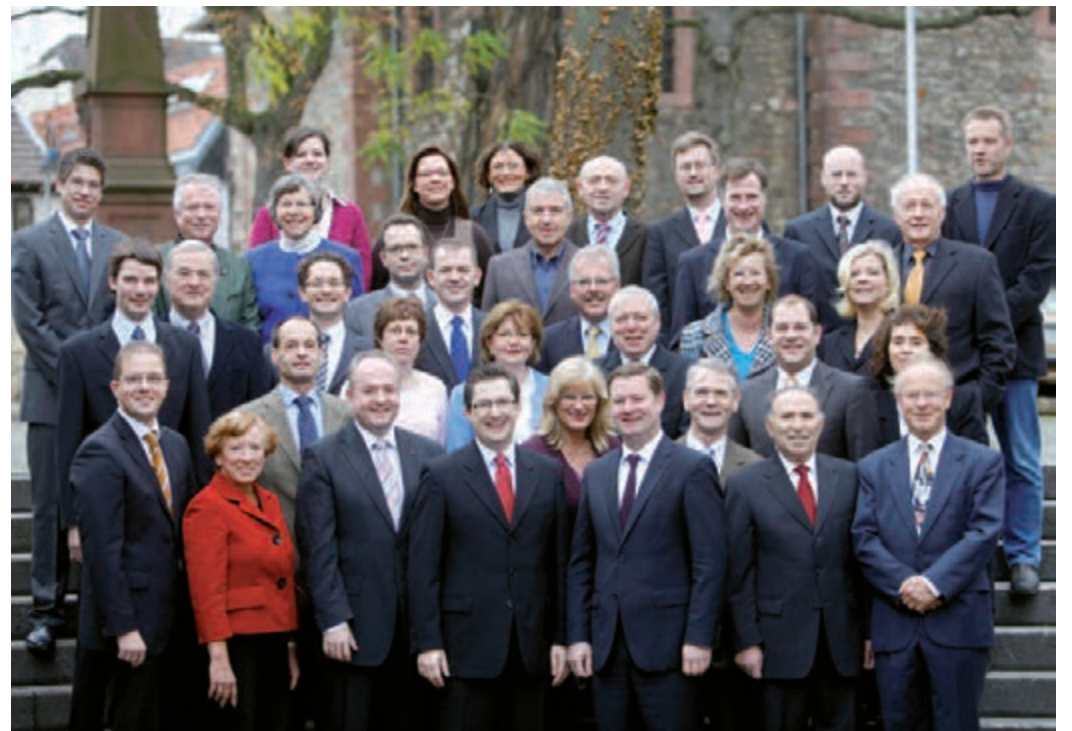
Mit diesem „Flörsheimer Schaufenster“ zeigen wir Ihnen einen Ausblick auf die kommenden fünf Jahre und dazu die Frauen und Männer, die sich für unsere Bürgerinnen und Bürger engagieren wollen. Sie werden alle Kraft für ihre Heimatstadt geben. Flörsheim am Main hat Leistung verdient. Die CDU Flörsheim ist bereit.

Die CDU Flörsheim ist, zum Wohle Flörsheims über die Grenzen der Stadt hinaus, politisch einflussreich.