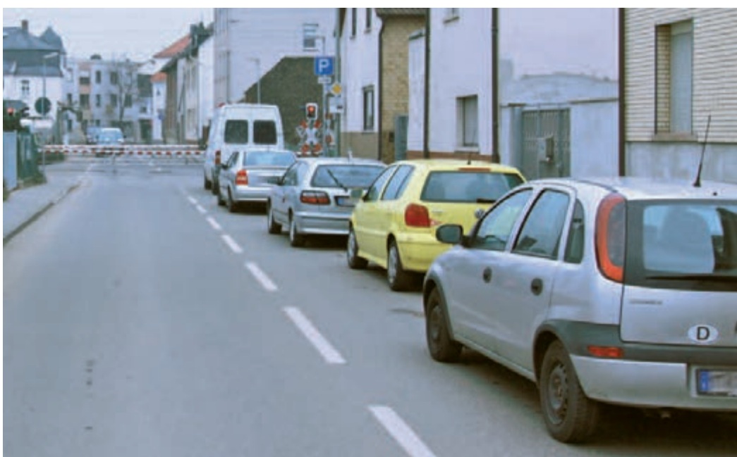
Das lange Warten vor den Bahnschranken in der Wickerer Straße wird bald ein Ende haben. Dann wird auch noch dieser letzte Bahnübergang in der Stadtmitte durch eine Unterführung ersetzt.